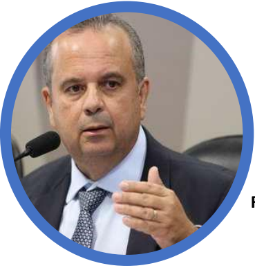
Rogério Marinho - Secretaria Especial de Previdência e Trabalho do Ministério da Economia