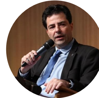
Adolfo Sachsida - Secretário de Política Econômica do Ministério da Economia