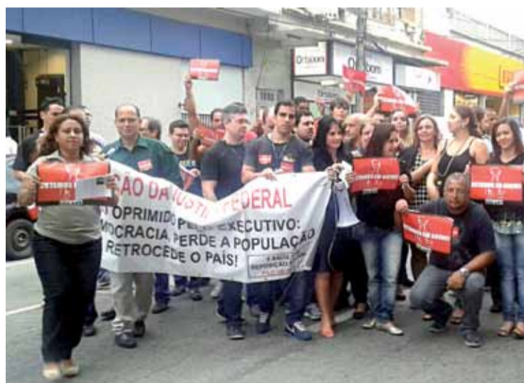
Momentos marcantes da greve na Capital e interior

Cada tecla tem um som diferente, mas pra fazer uma boa música não pode faltar nenhuma.